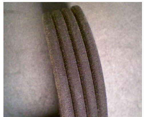
Esimerkki moniurahihnasta, johon on tehty muutoksia

Hihnoja, joihin on tehty muutoksia, voidaan käyttää luettelossa mainituissa autoteollisuuden käyttökohteissa. Ulkonäköeroista huolimatta uusi ulkoasu ei vaikuta suorituskykyyn.